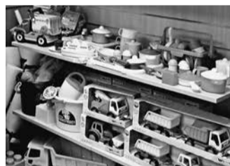
「ポリシエ」のおもちゃ。キッズ古着店で取扱う

キッズ古着店「エコ&キッズAKIRA」を国内80店以上チェーン展開するAKIRA(東京都江東区)が、子供服の新古品や新品おもちゃの取扱いを強化している。キッズ古着店から、「子供関連の総合ショップ」へ路線を拡大する方針だ。同社はブランド子供