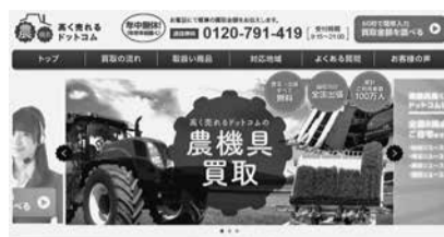
農機具高く売れるドットコムのトップページ

28の買取サイトを展開するネット型総合リユースのマーケットエンタープライズ(東京都中央区)が2月、農機買取サイト「農機具高く売れるドットコム」の展開を始めた。全国8拠点のリユースセンターから農家等への出張買取を行い、買い取った農機は古物市場での売却や越境ECで海外販売等する。扱う商材はトラクタ